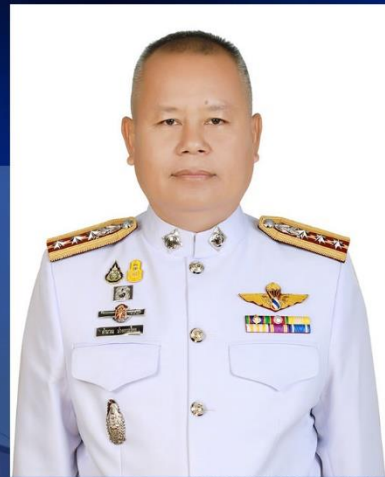
พันตำรวจเอกค้ำฉนวน ป้ายกระโทก ผู้กำกับการสถานีตำรวจภูธรโนนนารายณ์